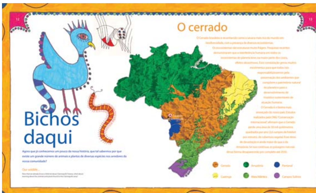
Binnenpagina Regionale Atlas van Clarínópolis over het dierenrijk en de savanne van de omgeving.